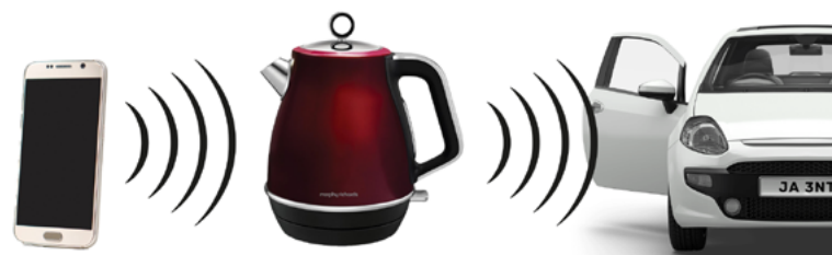
Internet of Things

Ci si potrebbe svegliare alle 6:00 del mattino e dal proprio cellulare far partire la caffettiera, la macchina, il riscaldamento e così discorrendo.