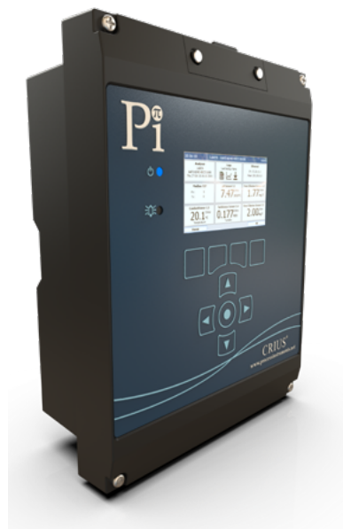
Analizzatore multiparametrico CRIUS®

La quarta (Industria 4.0) riguarda le fabbriche SMART (Intelligenti).